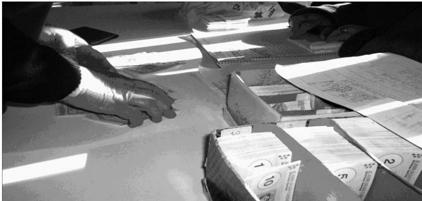
¿Cómo se oxida? Venado Tuerto (Argentina), agosto 2007.