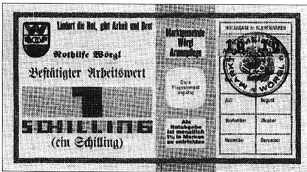
El Municipio de Wörgl (Austria), julio de 1932 a enero 1933.