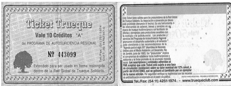
Red Global del Trueque (Argentina), 1995 a la actualidad.