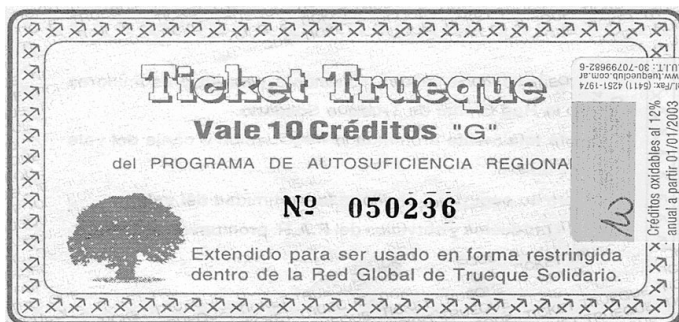
Venado Tuerto. Grupo de Economía Naturalista (Santa Fe, Argentina) 1999 a la actualidad.