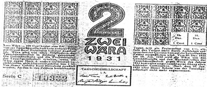
La primera experiencia. Los wära Erfurt (Alemania), octubre 1929 a octubre de 1931.