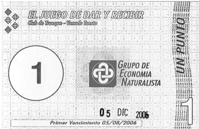
Billete en circulación desde el 05/04/06 al 05/12/06.