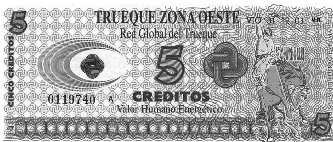
Red del Trueque Zona Oeste (Argentina)-1999 a la actualidad.