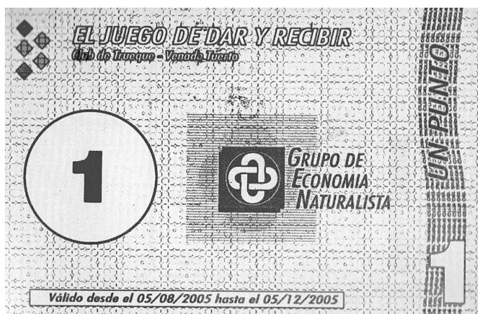
Billete en circulación desde el 05/08/2005 al 05/12/05.