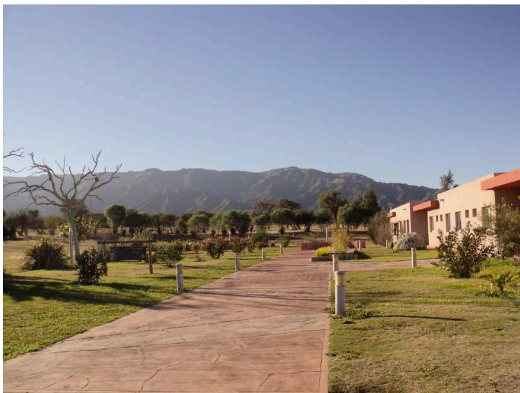
Instalaciones de San Luis Cine: Vista parcial.

Key words: local audiovisual policies, audiovisual promotion legislation, cinema, TV.