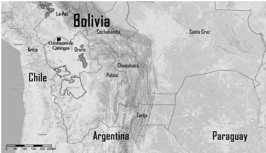
Mapa 1: Ubicación de Curahuara de Carangas, Oruro, Bolivia