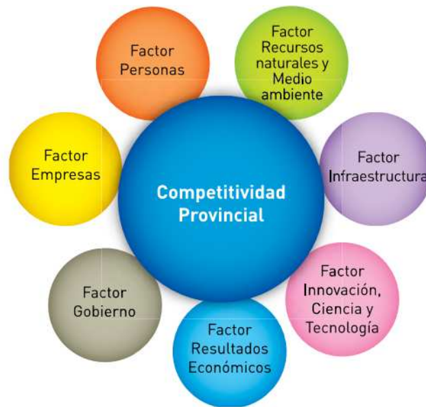
Gráfico 1. Las siete dimensiones del ICP