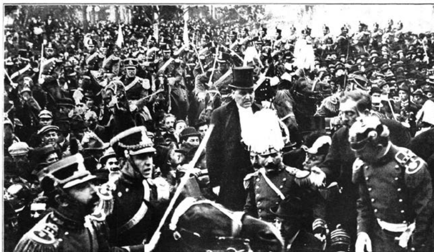
Imagen 5. El carro de Hipólito Yrigoyen es llevado a pulso por militantes radicales que desbordan la escolta oficial durante la asunción presidencial