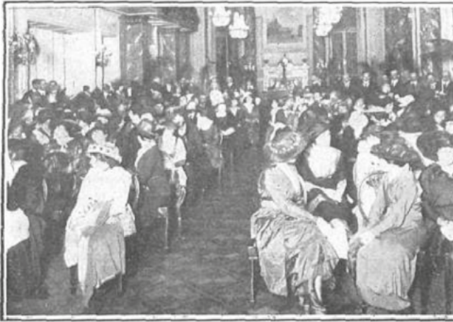
FIESTA DE BENEFICIO —Té a beneficio de las familias de los reservistas franceses, que han partido para la guerra; con ese motivo el éxito de la fiesta fué considerable.