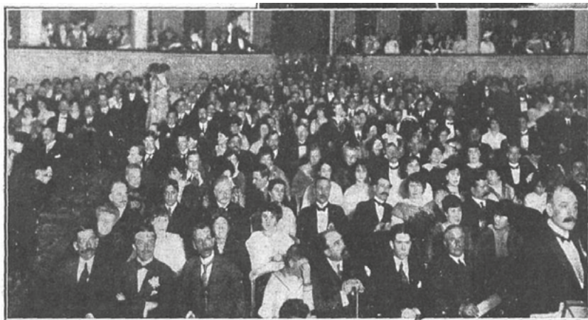
Gran velada en el teatro Colón, organizada por el comité «Anglo-franco-belga», a beneficio de las familias de los reservistas que han ido a la guerra. — Cuadro «Las naciones aliadas». — Concurrencia.