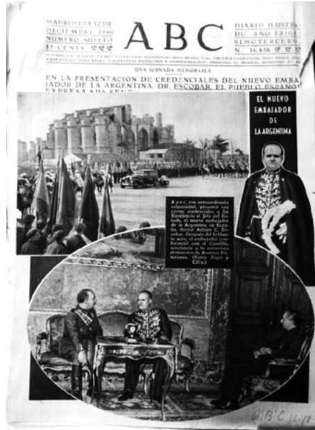
Imagen 1. Portada diario ABC , Madrid