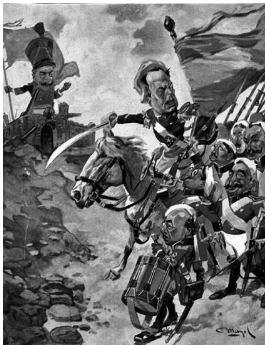
Imagen 1. Yrigoyen encabeza a los “boinas blancas” radicales en el asalto al “viejo orden”

Algunas publicaciones de actualidad ya se habían hecho eco de la forma en que los radicales consideraban sus credenciales revolucionarias del pasado como la mejor carta para derrotar el “viejo régimen”. La popular revista Caras y Caretas mostraba en una portada de octubre de 1912, a cargo del dibujante Manuel Mayol, un ejército con uniforme albirrojo y boinas blancas —el distintivo utilizado en los combates de 1890 y 1893—, al celebrarse las elecciones legislativas en Córdoba. La vistosa tropa estaba encabezada por Yrigoyen bajo la bandera tricolor del Parque durante el asalto de la ciudadela adversaria.