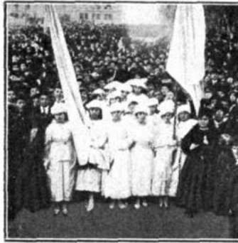
Comité feminista radical, que encabezaba la manifestación.