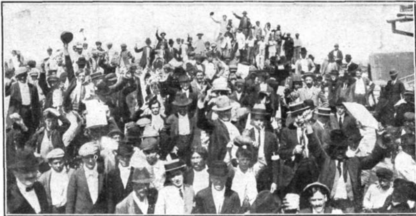
Adherentes del Partido Radical que concurren al almuerzo con que los dirigentes del comité Aristóbulo del Valle, le obsequiaran.