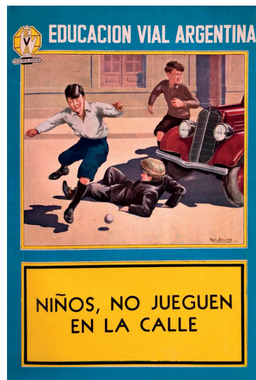
Figura 1. Afiche de campaña de educación vial de la Dirección Nacional de Vialidad, 1934

En Argentina, la difusión del automóvil implicó, como en otros lugares, un desafío para los gobiernos. Este objeto que circulaba por las calles y caminos del país dio lugar a una serie de iniciativas a nivel legal y nuevos aspectos de la vida social comenzaron a ser objeto de control. Las velocidades y sentidos de circulación, los lugares permitidos para estacionar, la identificación de los vehículos, los requerimientos técnicos necesarios, así como también la implementación del seguro obligatorio de responsabilidad civil fueron algunas de esas regulaciones. El desafío cobró distintas formas a nivel legal porque las leyes de tránsito se gestaron en distintos momentos históricos. Además de los cambios técnicos de los vehículos, la infraestructura cambiaba y las necesidades a las cuales dar respuesta también.