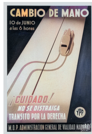
Figura 2. Afiche de campaña de cambio de mano, 1945