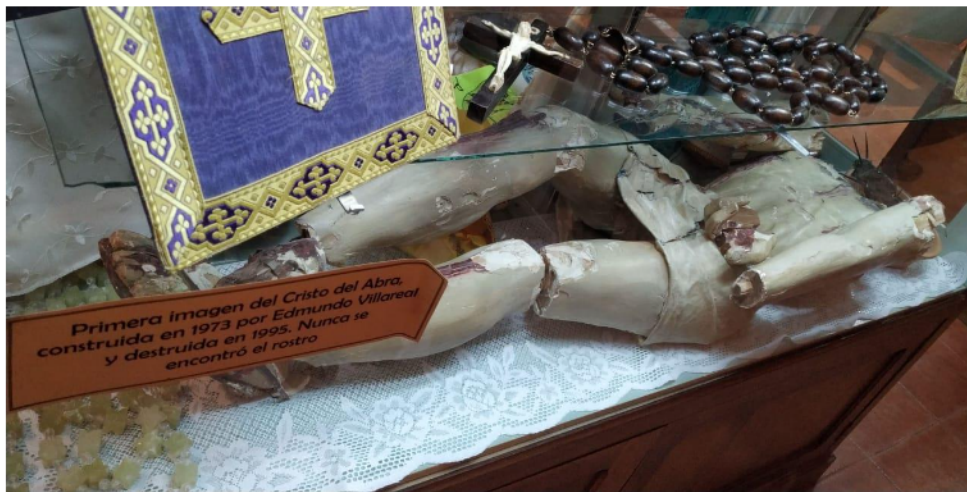
Imagen 2: Restos de "El Cristo Guerrillero", escultura de Edmundo Villarreal realizada en 1973 y destruida en 1995.