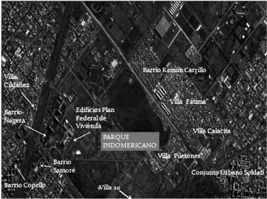
Figura 1. Distintos barrios que rodean al Parque Indoamericano