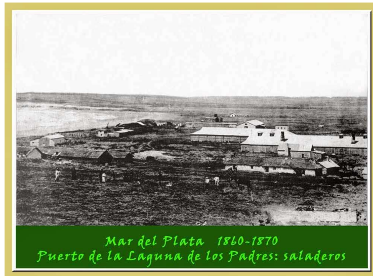
Figura 3. El puerto de la laguna de los Padres

hacienda antes de ser faenada. http://www.mardelplata-ayer.com.ar/saladero.html