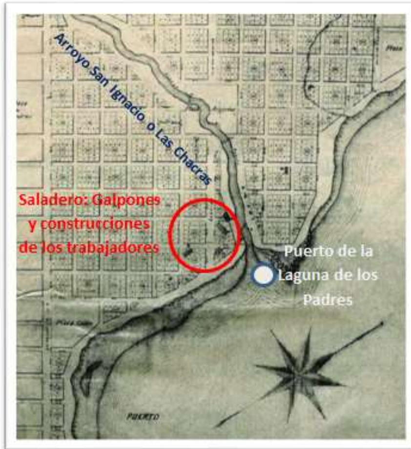
Figura 2: El saladero de Mauá y Meyrelles y sus construcciones

Fuente: Original de Carlos Chapeaurouge. Año: 1874.